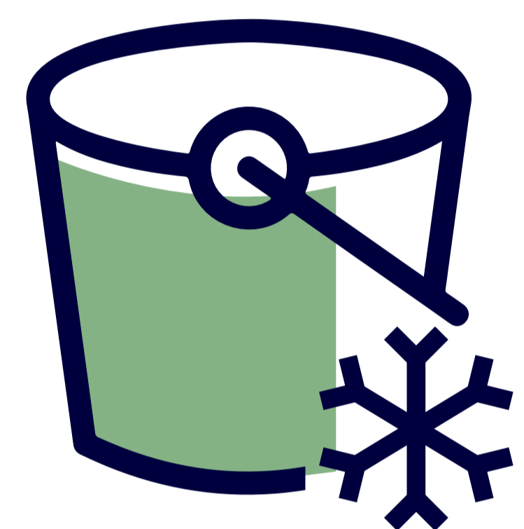
S3 Glacier Deep Archive

Esta es la opción más económica de Amazon S3 para almacenamiento de archivo a largo plazo. Ofrece la misma durabilidad que S3 Glacier, pero con un tiempo de acceso más largo, lo que lo hace adecuado para datos que rara vez se necesitan. Es perfecto para el archivado de datos a largo plazo que se deben retener por razones reglamentarias o de cumplimiento.